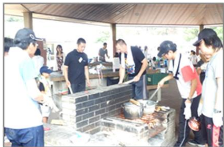
1) 1対1の関係づくり、小集団、数十人の集団という段階的にコミュニケーションが深まるグループワーク