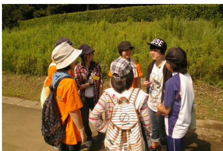
3) 将来のモデルとなることを目的とした高校生によるピアアシスタント、メンタルサポーターの配置