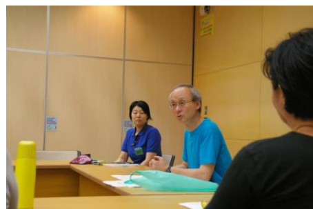
2) 子育てに関する自信回復を目的にした専門家によるグループカウンセリング